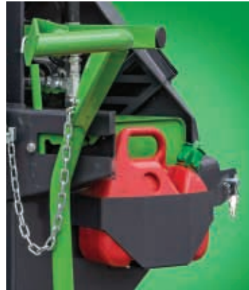
Halter für Kanister und Säge