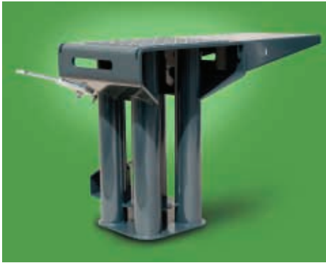
Spalttisch mit Tisch- erweiterung