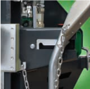
Sperre des Hebebügels (Patent SI 23537)