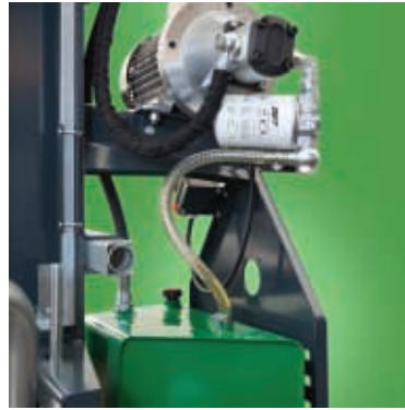
Die Ausführung E