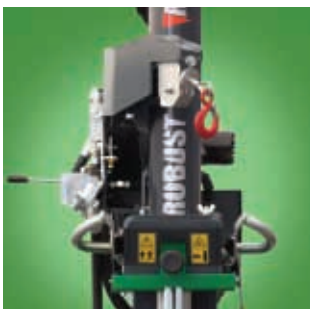
Optimale Gestaltung der Hydraulische Seilwinde