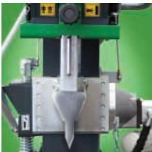
Einfache Einstellung des Axtgangs