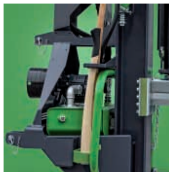
Halte für Axt und Sappie