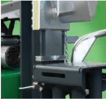
Die Ausführung Holzhaltespitze mit linkem Hebel oben