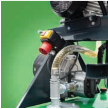
Die Ausführung EK und Saugfilter im Öltank