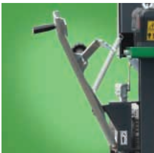
Beweglicher linke Hebel (Patent SI 23536)