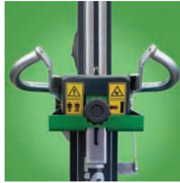
Die Ausführung Holzhaltespitze mit linkem Hebel oben